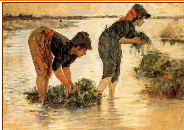
Le gramignaie al fiume di Niccolò Cannicci [Pubblico dominio], via Wikimedia Commons

Riflessioni critiche e proposte per la realizzazione di un curriculum verticale inclusivo